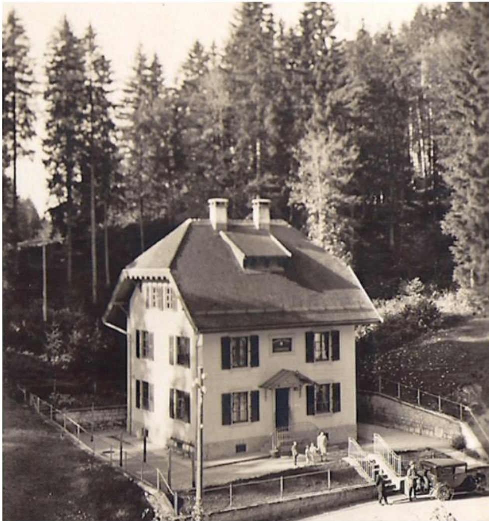
Douane de l'Helvétia à l'Ecrenaz – Commune La Brévine / Les Taillères NE Photo datant de l'été 1934

Un voyage dans le temps suivant le tracé de la frontière franco-suisse et les bornes qui séparent les deux pays. Culminant à 1'173 m d'altitude, le sentier progresse dans le superbe décor de la Vallée de La Brévine.